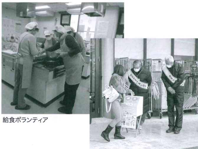
給食ボランティア